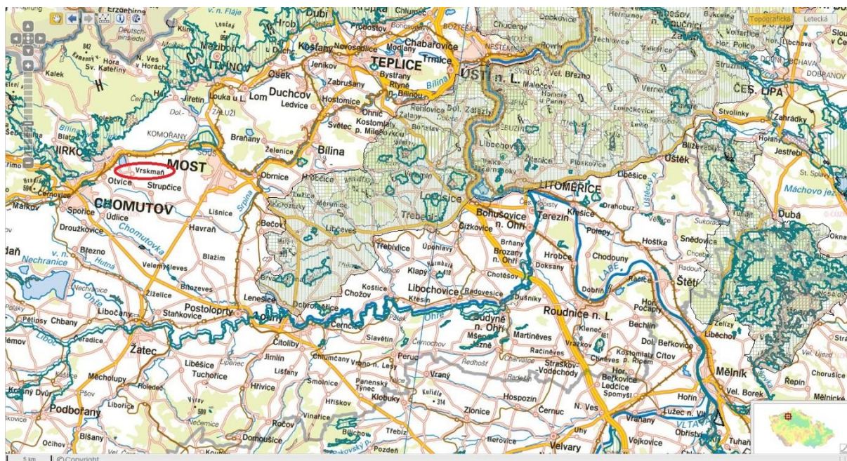
Obrázek 1 Širší územní vztahy