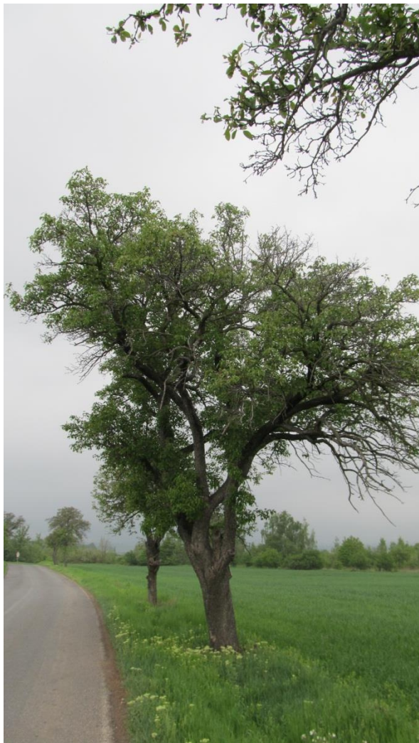
Obrázek 5 Alej č. 1