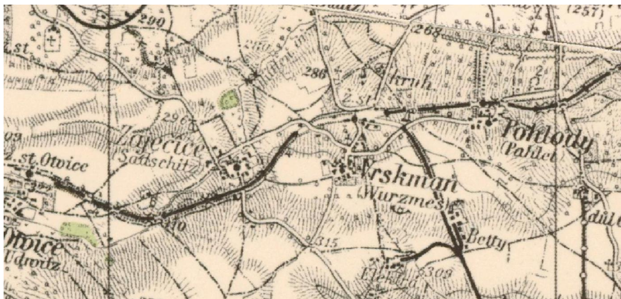
Obrázek 3 Historická mapa III. vojenské mapování 1877-1880

Toto rozhodnutí nastartovalo nový rozvoj obce, došlo ke stavebním úpravám obecních domů, k obnově spolkového života a dokonce i k nové výstavě na okrajích obce. V obci byl vypracován nový územní plán, umožňující další rozvoj.