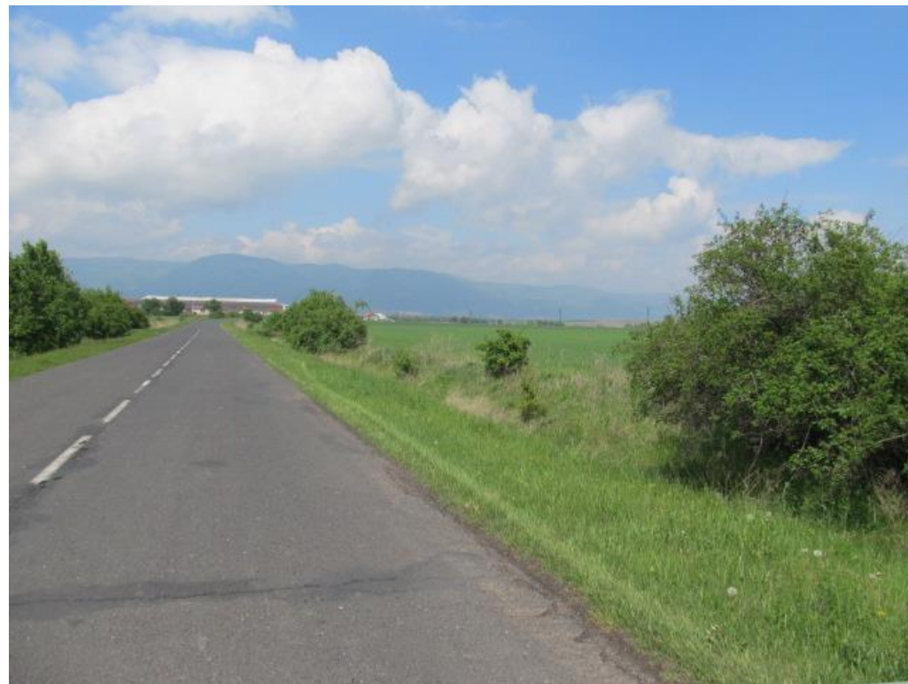
Obrázek 11 plocha navrhovaného stromořadí, prvek č.5