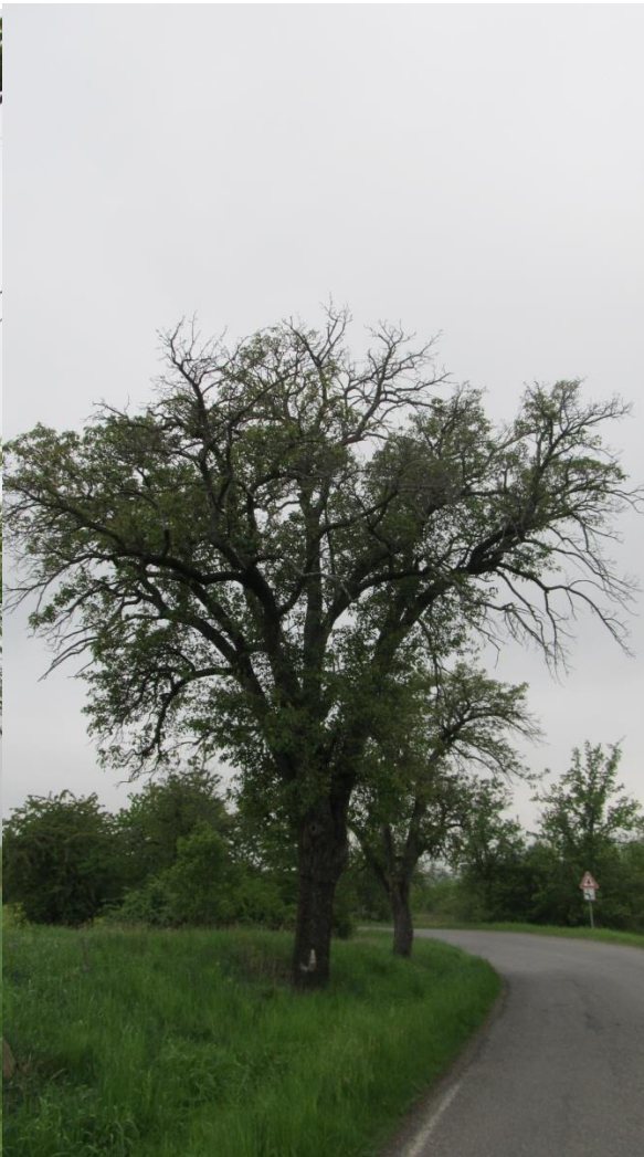
Obrázek 6 Alej č. 1