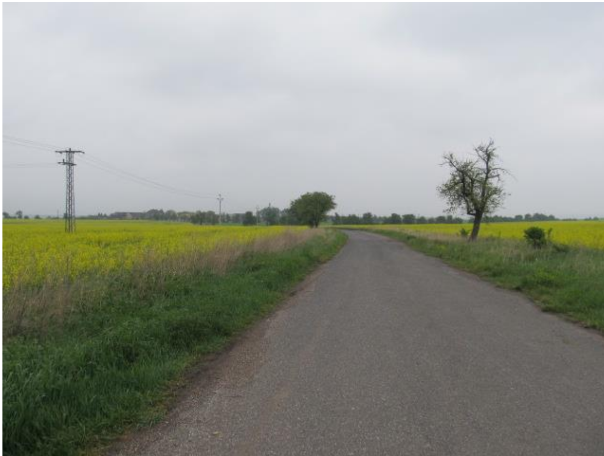
Obrázek 8 Alej č. 3