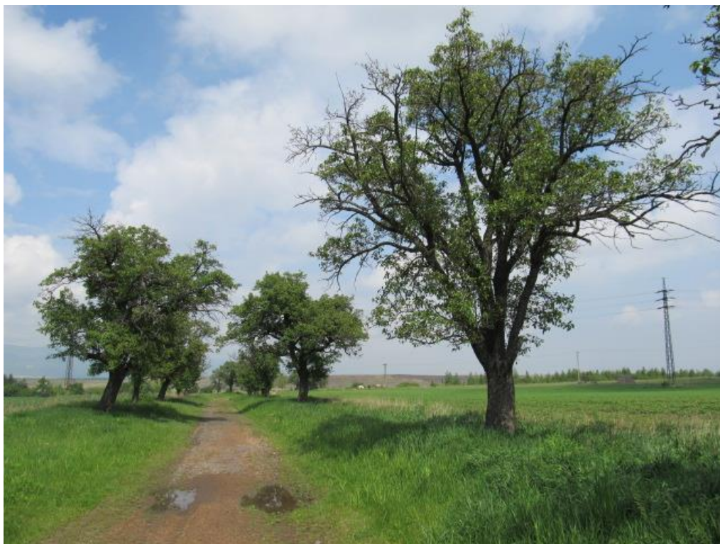
Obrázek 10 Alej č.4