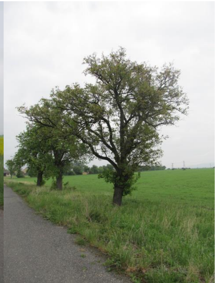
Obrázek 9 Alej č. 3