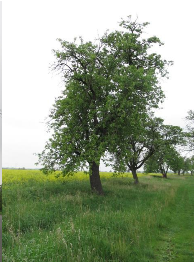
Obrázek 7 Alej č. 2